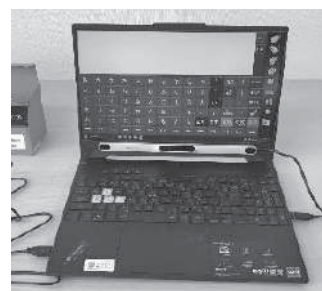
視線入力（デモ機あり）